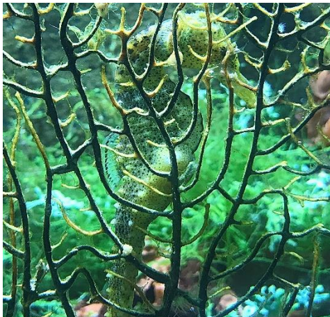
Kan je me zien? Door mijn gele kleur val ik bijna niet op tussen deze planten

verschillen tussen zeepaardjes en andere vissen. Als één van de weinige vissoorten zwemmen wij rechtop. Zeepaardjes horen bij de langzaamste zwemmers in de zee. Dat komt omdat we geen staartvin hebben zoals andere vissen. We zijn dus heel wat langzamer dan de zeilvis. Dat is de snelst zwemmende vis in de zee. Als wij sneller vooruit willen komen, gebruiken we de stromingen van de zee. En als we ergens even willen blijven hangen, krullen we onze staart gewoon om de stengel van een plant.