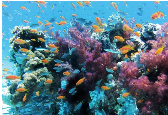
Een gezond koraalrif bestaat uit ontzettend veel dieren, planten en goede bacteriën

Wij zeepaardjes jagen overdag op plankton, kreeftjes en kleine visjes. We zuigen ons eten door onze snuit naar binnen. Omdat we een kleine mond en geen tanden hebben, kunnen we alleen kleine prooien eten. Om voldoende voedingsstoffen binnen te krijgen, moeten we daarom veel prooien eten. We verstoppen ons tussen de waterplanten en het kleurrijke koraal om ons eten te vangen. Wisten jullie dat koraal bestaat uit ontelbaar veel kleine koraaldiertjes? Met deze dieren hebben wij dus een belangrijke relatie.